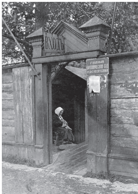
Рис. 6. Вход в Главный ботанический сад РСФСР. Конец 1920-х гг.