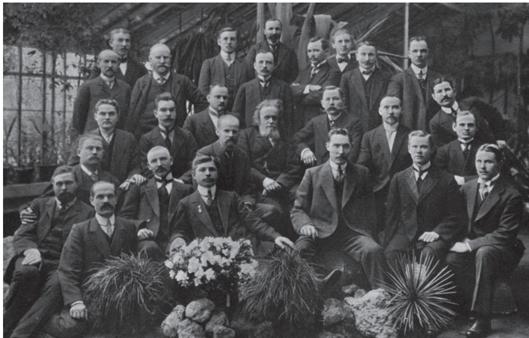
Рис. 3. Садовники Императорского ботанического сада, 1913 г. (Императорский... 1913. Вклейка между с. 272–273)