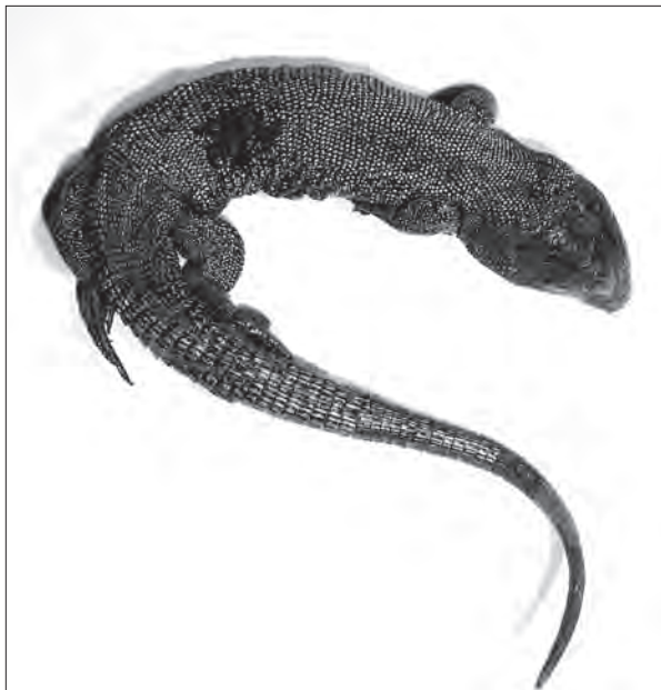
Рис. 2. Ящерица Бёме, Lacerta agilis boemica Suchow, 1929 из сборов Г.Ф. Сухова в коллекции ЗИН РАН.

26 апреля 1938 г. было принято постановление Совета народных комиссаров СССР «Об учёных степенях и званиях». На основе этого постановления учёные советы учреждений Академии наук должны были обсудить, кто достоин степеней и званий. Возможно, что упомянутая автобиография Г.Ф., составленная в 1939 г., имела отношение именно к этому постановлению. Комиссия президиума Академии наук обсуждала кандидатуры