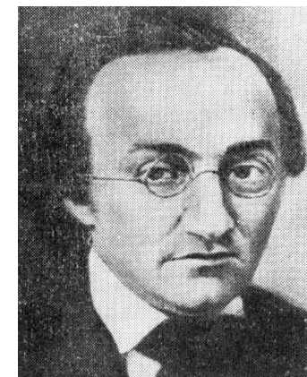
А. П. Вальтер (Макаренко, Полякова, 1991, с. 20)