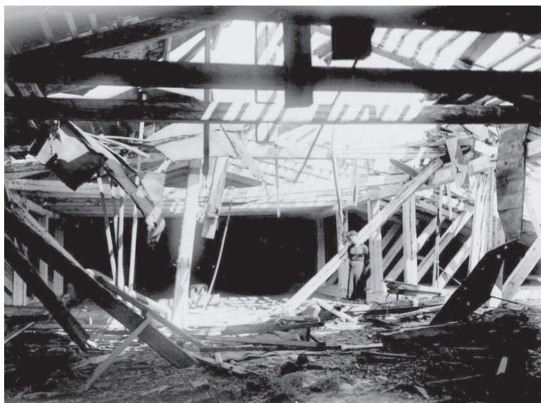
Чердак здания ЗИН, поврежденного в бомбежке 21 августа 1943 г.