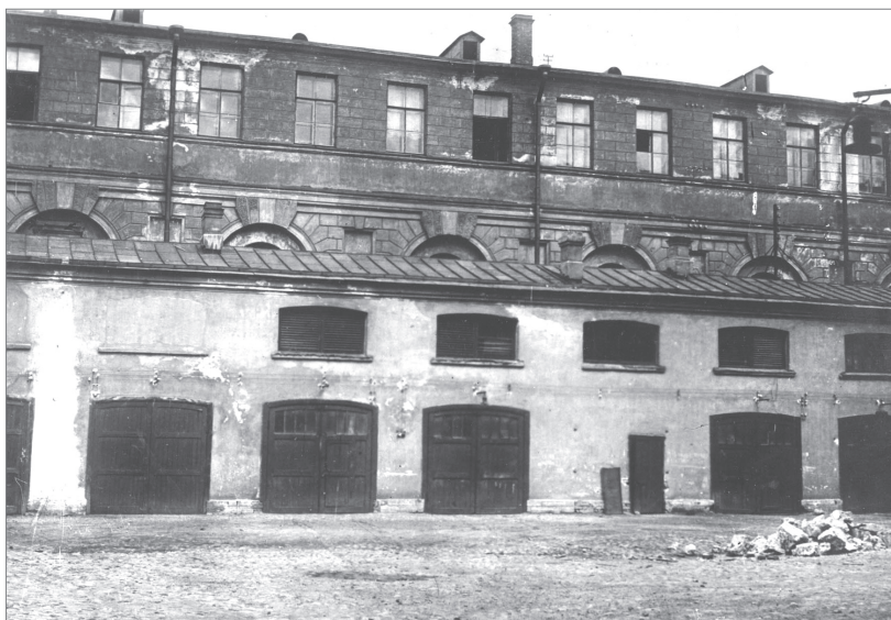
Вид двора после первого воздушного налета.