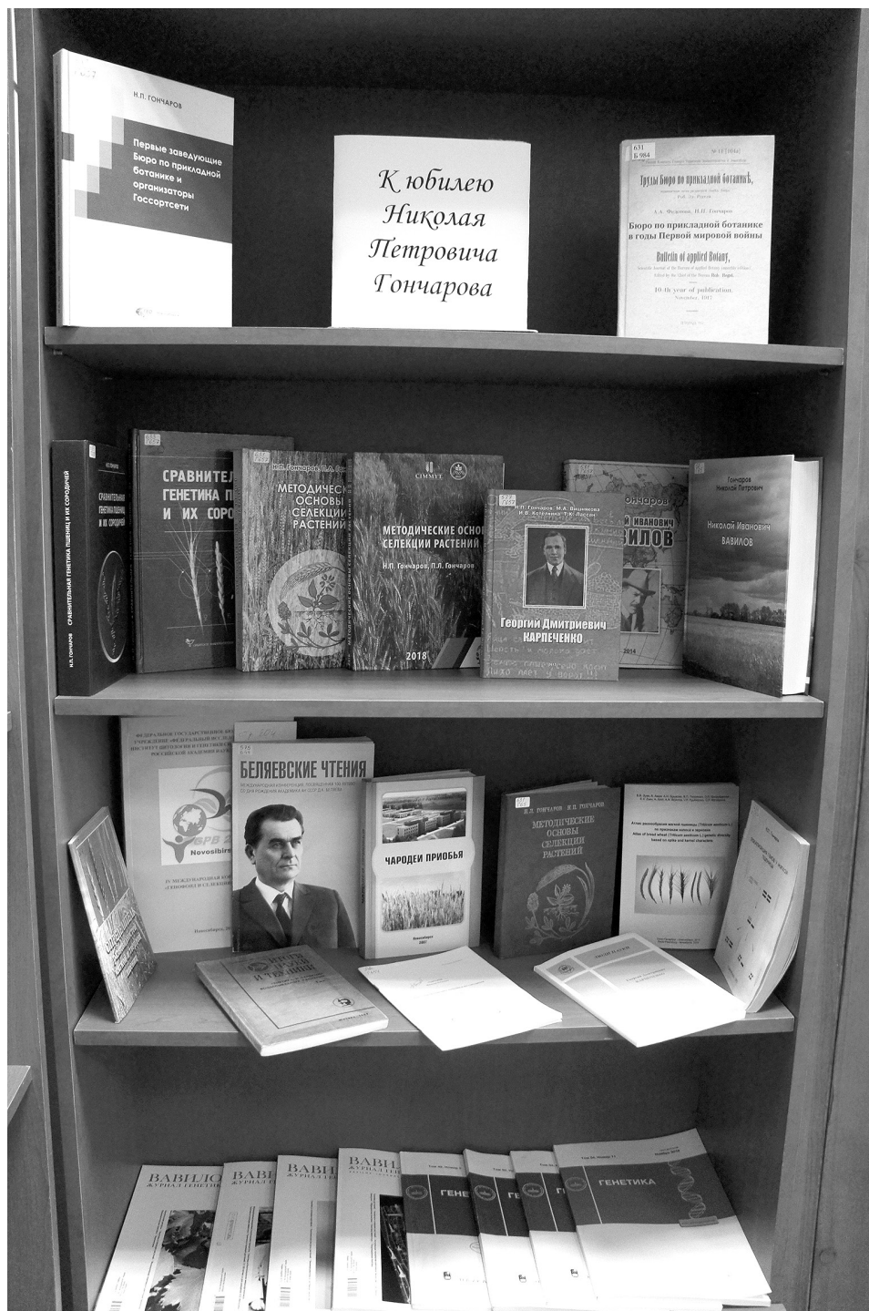
Рис. 7. Выставка в библиотеке ИЦиГ СО РАН. Fig 7. Exhibition in the ICG SB RAS library.