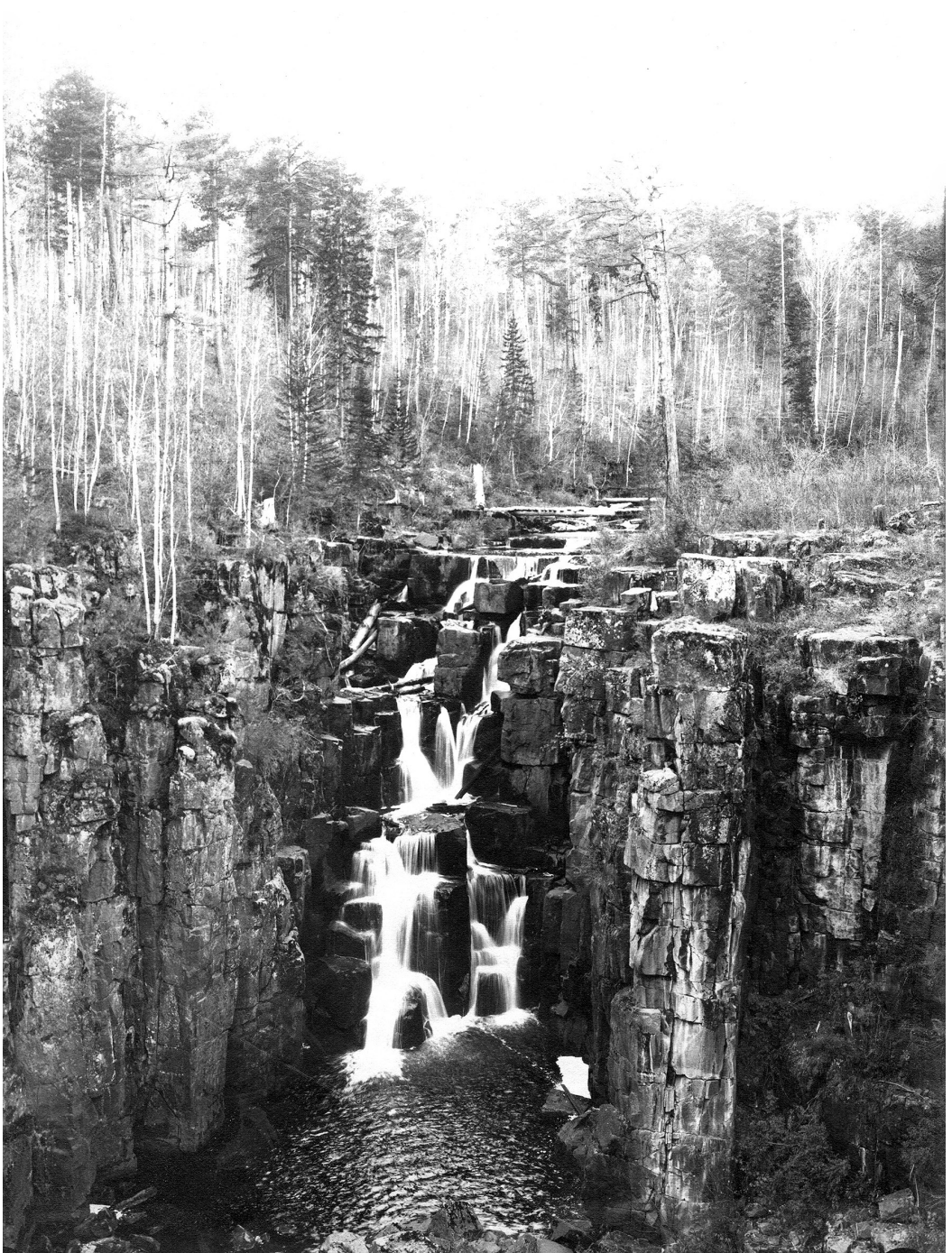
Рис. 1. Уковский водопад. Фото строителей Транссиба. 1890-е гг. (из архива А.В. Родионова (архив БИН РАН))