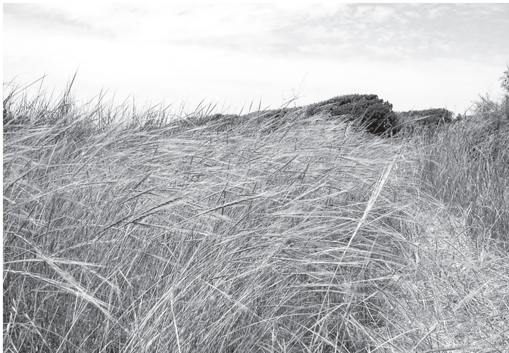
Рис. 4. Ae. sharonensis в Шаронской долине. На заднем плане видны песчаные дюны.

Представлял интерес и сбор родственного пшеницам диплоидного вида Aegilops speltoides Tausch — донора генома В полиплоидных пшениц, изредка произраставшего в смешанных популяциях с другими видами Aegilops (Raskina et al., 2004). В целом биоразнообразие на территории Израиля сохраняется, чему в значительной степени способствуют и политические причины (резерватами генофонда диких пшениц становятся минные поля и запретные для прохода приграничные зоны, ограждённые колючей проволокой). Впрочем, в этом отношении Израиль не исключение: как отметил Н.П. Гончаров, так сложилось, что местообитание как диких пшениц, так и диких