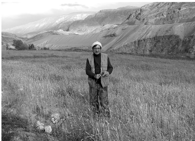
Рис. 2. Сбор материала. Памир. Горный Бадахшан. Fig. 2. Collection of material. Pamir. Mountain Badakhshan.

Первая международная экспедиция «по следам» Н.И. Вавилова, возглавляемая Н.П. Гончаровым, состоялась в 2010 г. на Памир, при поддержке руководства АН Республики Таджикистан в лице её вице-президента и директора Института физиологии и генетики растений АН РТ академика Х.Х. Каримова. Н.И. Вавилов побывал здесь дважды: в 1916 году (въехав с территории Российской империи) и в 1924 году (маршрут пролегал со стороны Афганистана). В ходе своих экспедиций, добираясь порой в самые труднодоступные области этой горной системы, Николай Иванович последние сборы сделал на высоте 3150 метров (возле кишлака Вичкут), определив этим уровнем верхнюю границу местной земледельческой зоны. В наше время эта граница сколь-нибудь существенно не изменилась, сборы образцов в экспедиции 2010 года были завершены возле того же самого кишлака Вичкут, на той же высоте 3150 метров. Надо отметить, что земледельческая зона на Памире довольно мала, порядка 12 тыс. га (что сопоставимо с посевными площадями одного крупного хозяйства Новосибирской области). Немного выше (3440 м над уровнем моря) расположен стационар Джилалды Памирского биологического института (самая высокогорная биостанция на Памире), где также побывал Николай Петрович с товарищами по экспедиции. Правда, здесь, по данным его сотрудников, даже местная холодостойкая рожь вызревает далеко не каждый год.