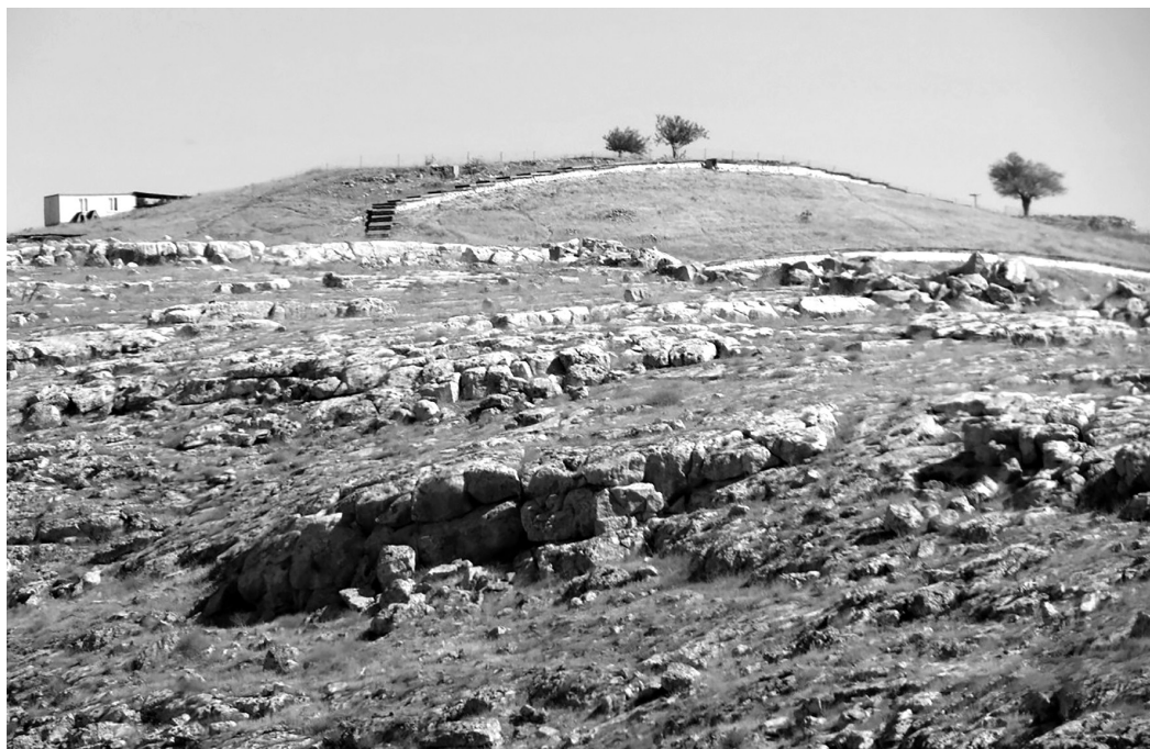
Рис. 6. Здесь зародилась наша цивилизация. Гёбекли-Тепе. Турция. Fig. 6. Here our civilization was born. Gobekli Tepe. Turkey.