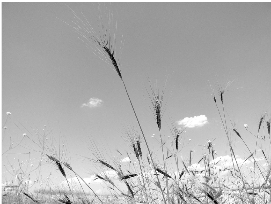
Рис. 5. Популяции диких пшениц и эгилопсов в предгорьях Главного Тавра. Турция Fig. 5. Wild wheat and egilops populations in the foothills of the Main Taurus. Turkey

Следующая совместная международная российско-японско-турецкая экспедиция 2014 г. была посвящена изучению динамики биоразнообразия domesticiрованных растений на территории Турции — Главном Тавре, регионе, который сейчас считается центром доместикиции пшениц (Willcox, 2005). Экспедиция прошла по достаточно протяжённому маршруту: Адана (область Чукурова) — Джейхан — Османия — Кадирли — Козан — Элбистан — ил Кахраманмараш — Арабан — Газиантеп — граница с Килизом — Низир — Шанлыурфа — Карабидикей — Адана — Кападокия — Адана (горные районы юго-западной Турции). Оказалось, что дикая тетраплоидная пшеница T. dicoccoides вполне успешно произрастает на ныне заброшенных фермерами горных полях. Это позволило сделать вывод, что территория произрастания этого вида не ограничена Израилем и Ливаном, как считалось ранее, и занимает практически всю