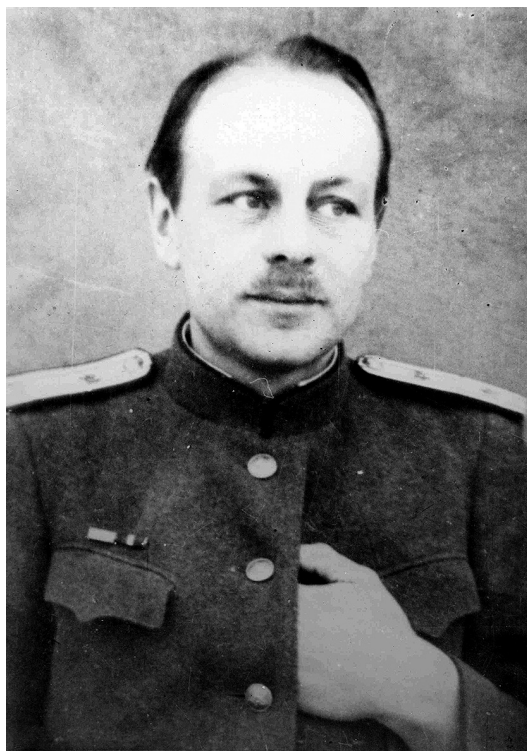
Рис. 6. Ю.И. Полянский. Ленинградский фронт, 1944 Fig. 6. Yu.I. Poljansky. Leningrad Front, 1944

ром в школе он увлекался театром и, играя в нескольких драматических постановках, даже одно время видел себя в будущем актером. Жаль, но, кажется, киносъёмки его выступлений нет, хотя даже некоторые фотографии дают представление о динамике (пластике) лектора.