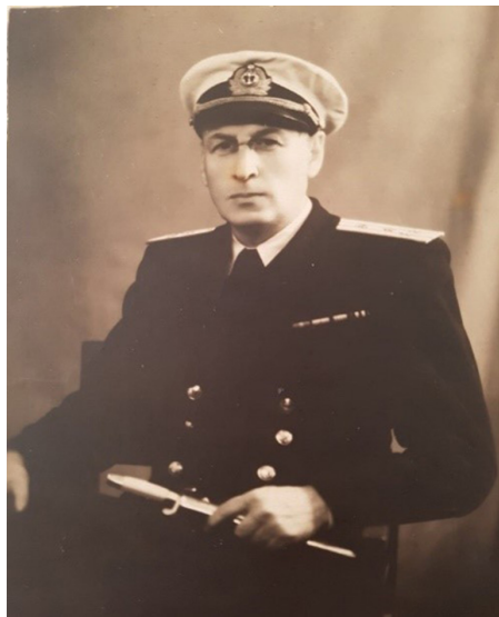
Рис. 1. Георгий Львович Френкель Fig. 1. George Lvovich Frenkel