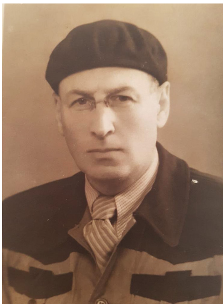
Рис. 2. Георгий Львович Френкель в 50-е годы Fig. 2. George Lvovich Frenkel in the 50s

отделением Ошской областной больницы. После неоднократных попыток (мешал ярлык спецпереселенца) в 1956 г. он поступает в аспирантуру Киргизского мединститута, где в это время работал Георгий Львович Френкель. Эта встреча и предопределила всю дальнейшую судьбу отца.