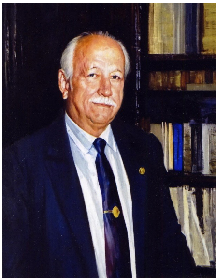
Рис. 8. А.В. Филиппов. «Портрет академика А.Ф. Алимова». 2021. ЗИН РАН Fig. 8. A.V. Filippov's "Portrait of Academician A.F. Alimov." 2021

Подводя итог, можно сказать, что Александр Фёдорович Алимов (рис. 8) достойно принял эстафету у знаменитых гидробиологов Зоологического музея и института, среди которых Н.М. Книпович, С.А. Зернов, В.И. Жадин, и передал её следующим поколениям. Он оставил яркий след и как директор, возглавлявший институт в трудные первые постсоветские годы, вписав важную страницу в историю ЗИН РАН, которой всегда глубоко интересовался и изучение которой активно поддерживал. Он запомнится и как неординарная личность с ярким художественным даром.