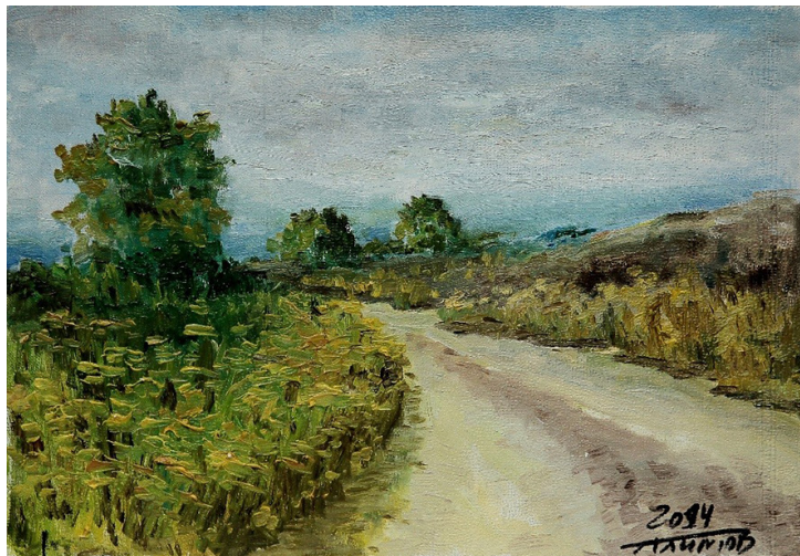
Рис. 7. А.Ф. Алимов. «Дорога». 2014, картон, масло Fig. 7. A.F. Alimov. "The Road". 2014, cardboard oil

Подводя итог, можно сказать, что Александр Фёдорович Алимов (рис. 8) достойно принял эстафету у знаменитых гидробиологов Зоологического музея и института, среди которых Н.М. Книпович, С.А. Зернов, В.И. Жадин, и передал её следующим поколениям. Он оставил яркий след и как директор, возглавлявший институт в трудные первые постсоветские годы, вписав важную страницу в историю ЗИН РАН, которой всегда глубоко интересовался и изучение которой активно поддерживал. Он запомнится и как неординарная личность с ярким художественным даром.