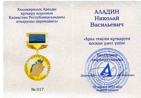
Рис. 4. Удостоверение к почётному знаку Международного фонда спасения Аральского моря