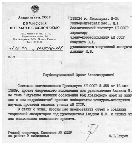
Рис. 3. Письмо из комиссии АН СССР по работе с молодёжью