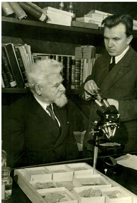
Рис. 1. Л.С. Берг и А.Н. Световидов. 21 декабря 1938 г.

ми академиками и членами-корреспондентами АН СССР в Казахстан, на курорт Боровое.