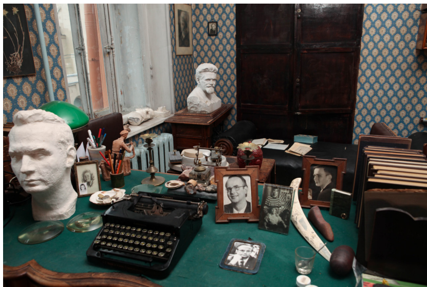
Рис. 2. Домашний кабинет Л.С. Берга. 2019 Fig. 2. L. S. Berg's study at home. 2019

На письме стоит отметка адресата: «получено 15.12.1941». Письма в первые месяцы войны шли долго, и ответов Анатолий Николаевич не получал.