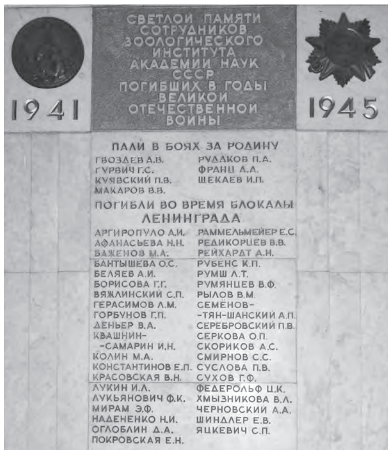
Рис. 1. Мемориальная доска с именами погибших в годы Великой Отечественной войны сотрудников Зоологического института АН СССР (главное здание ЗИН РАН)

Работая в Национальном музее Грузии им. Симона Джанашиа (бывший Кавказский музей) в г. Тбилиси, в каталоге герпетологической коллекции в столбце с указанием специалистов, определивших таксон животного, рядом с фамилиями А.М. Никольского, Л. Мехели, Л.А. Ланца, И.С. Даревского и других известных зоологов, я неоднократно обращал внимание на имя Сухова. При этом в каталоге имеются два варианта записи его фамилии — «Сухов» и «Suchow» 2 . Судя по датам сбора определённых им кавказских представителей рода Lacerta , он посетил (посещал?) Тбилиси после 1929 г.